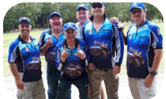
Late last month, the Anglers Club headed down to Hastings to chase the Whiting. A great day was had by all that attended.