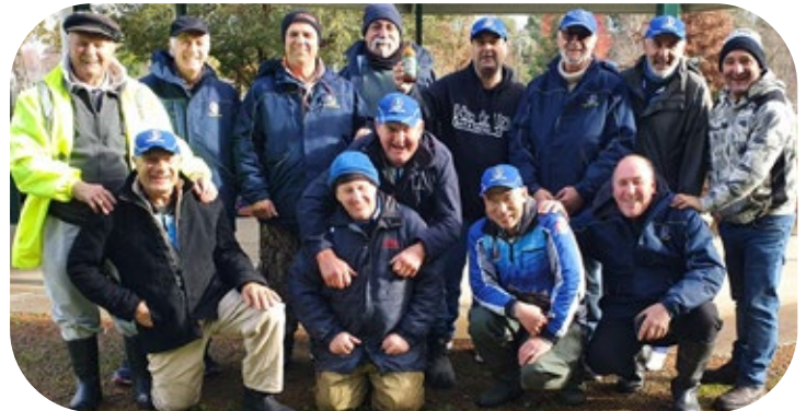
Our Anglers Club enjoying their recent fishing trips.