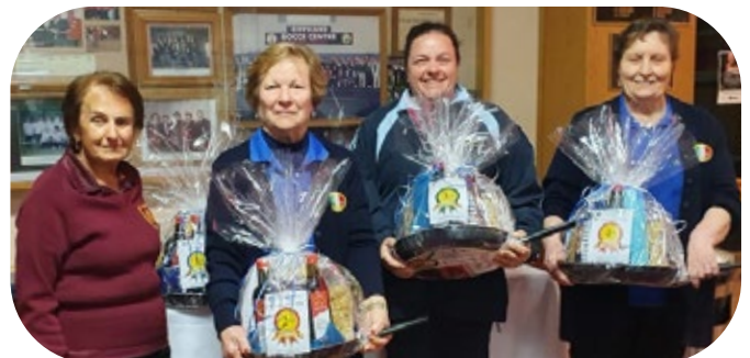
Congratulations to all of our winners from the recent Bocce games.

If you'd like to book a Christening, Communion, Confirmation, Wedding, Anniversary or any special occasion, please do not hesitate to contact the Club to book your next event, call us on 9701 8888.